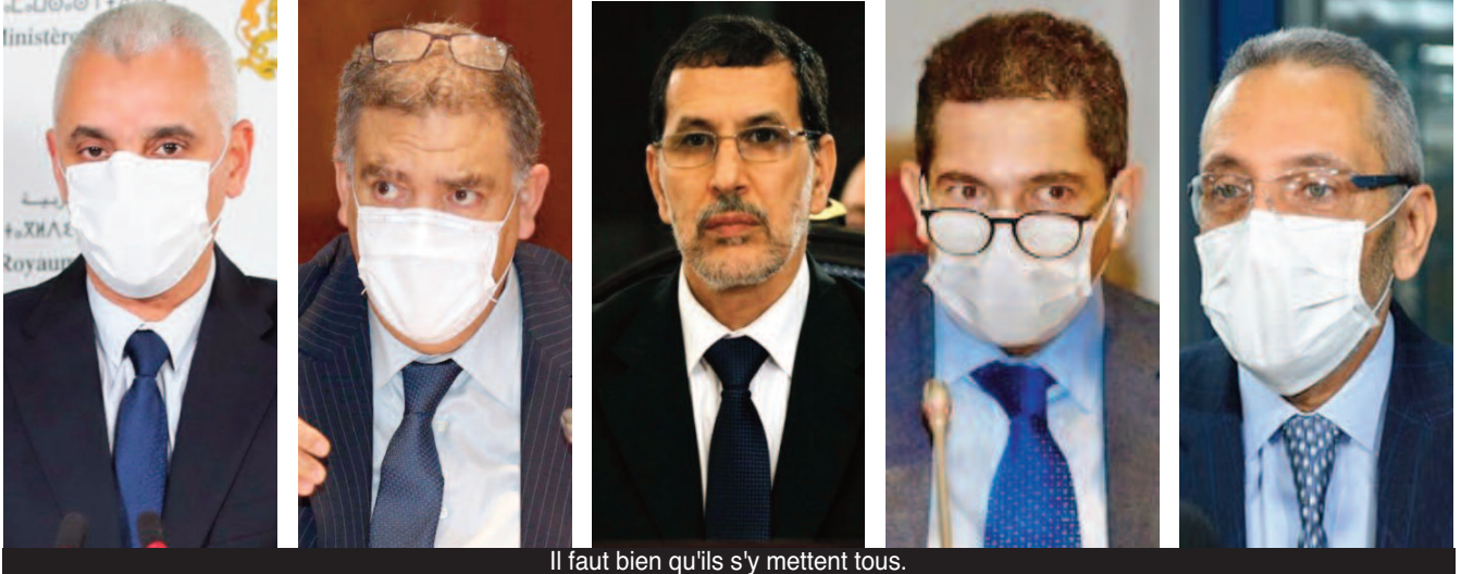
Il faut bien qu'ils s'y mettent tous.

« L'angoisse suppose le désir de communiquer », disait l'écrivain français Georges Bataille. Il ne faut tout de même pas aller jusqu'à dire que nos responsables ne ressentiraient pas une certaine angoisse par les temps qui courent. Comme il ne faut pas non plus penser qu'ils le seraient outre mesure. Ils seraient cependant merveilleusement inspirés de nous le faire savoir. Et dans les normes surtout. Sinon l'on risque fort de se laisser aller à répéter avec le célèbre romancier et journaliste brésilien Paulo Coelho que « la folie c'est l'incapacité de communiquer ses idées ». Même si dans le cas d'espèce, il ne s'agit pas vraiment d'idées mais plutôt du quotidien d'un peuple assoiffé d'une information fiable. Raison de plus.