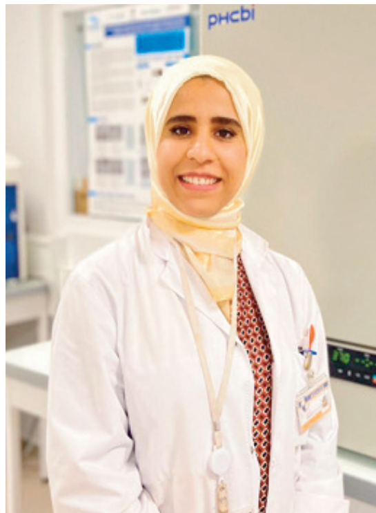
Je compte mener une collaboration entre l'équipe marseillaise et une équipe marocaine. Cela fait partie de mes objectifs.